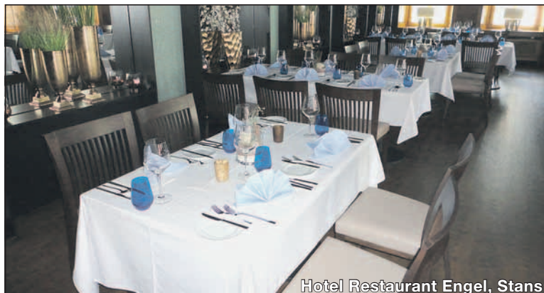
Hotel Restaurant Engel, Stans