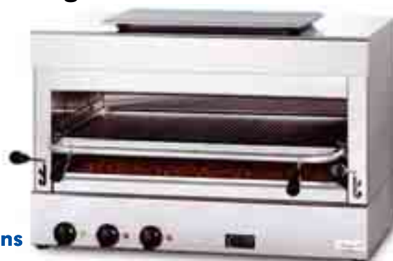
Big BeefGrill mit über 800 °C Leistung

Im Riet 7, 8308 Illnau / ZH, T: 052 346 24 27 info@gamatech.ch, www.gamatech.ch