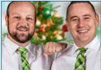
CC-Aligro senkt die Preise S. 3/17