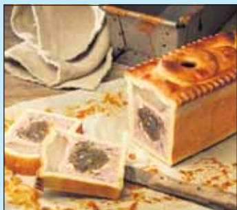
Weihnachtliche Genüsse S. 7

Besuchen Sie uns auch im Internet: www.gastro-anzeiger.ch