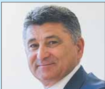
Beratung S. 25