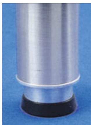
Tischfuss versenkt eingebaut.

SCHARPY GMBH, 5012 Schönenwerd mail@scharpy.ch, www.niveler.ch