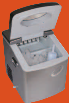
NOVAMATIC IICE 20 Eiswürfelmaschine • Speicherkapazität 1.5 kg Art. Nr. 10629416