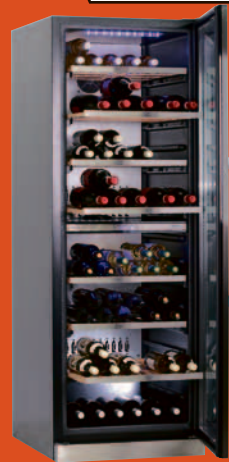
NOVAMATIC Vinocave 2165 Weinklimaschrank • H/B/T: 180 x 67 x 78 cm • Temperaturbereich individuell +5 °C bis +18 °C Art. Nr. 10193411