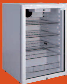
KIBERNETIK. 131 GS Gewerblicher Kühlschrank • Nutzinhalt 115 l Art. Nr. 10507785