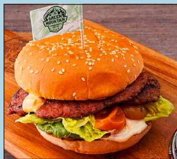
Null Fleisch – Ächt smashed S. 6/17