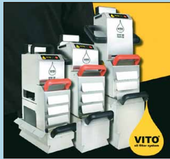
Frittieröl sparen S. 5